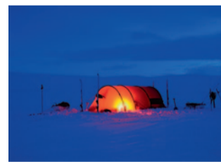
Dezember: Norwegen, Hardangervidda