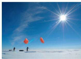
Juli: Grönland, Inlandeis