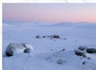
Januar: Norwegen, Krækkjhytta, Hardangervidda