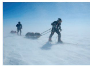
November: Grönland, Inlandeis