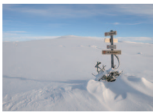
August: Norwegen, Lågaros, Hardangervidda