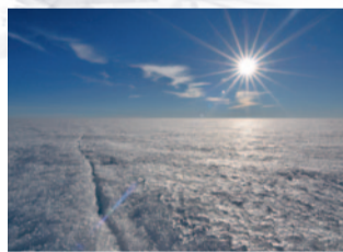
Oktober: Grönland, Inlandeis