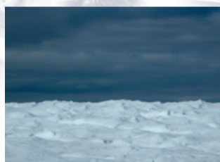
März: Grönland, Inlandeis