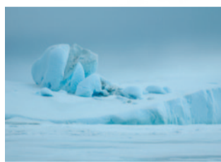
September: Grönland, Sermilik-Fjord