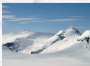
April: Norwegen, Lodalskåpa, Breheimen