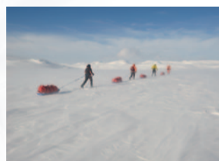
Mai: Norwegen, Låven, Hardangervidda